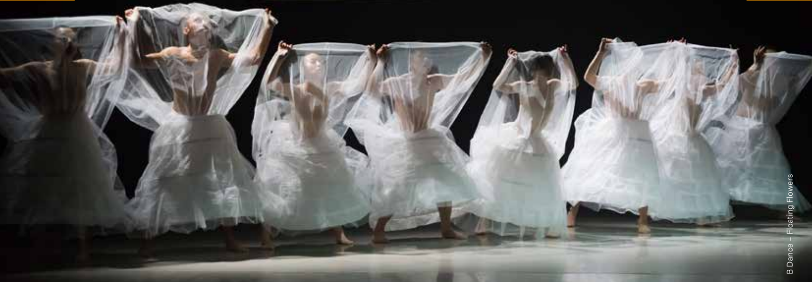
B.Dance – Floating Flowers