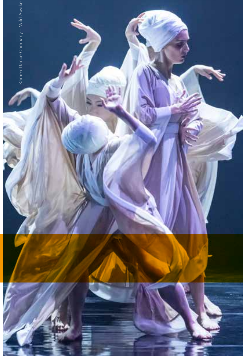
Kamea Dance Company – Wild Awake