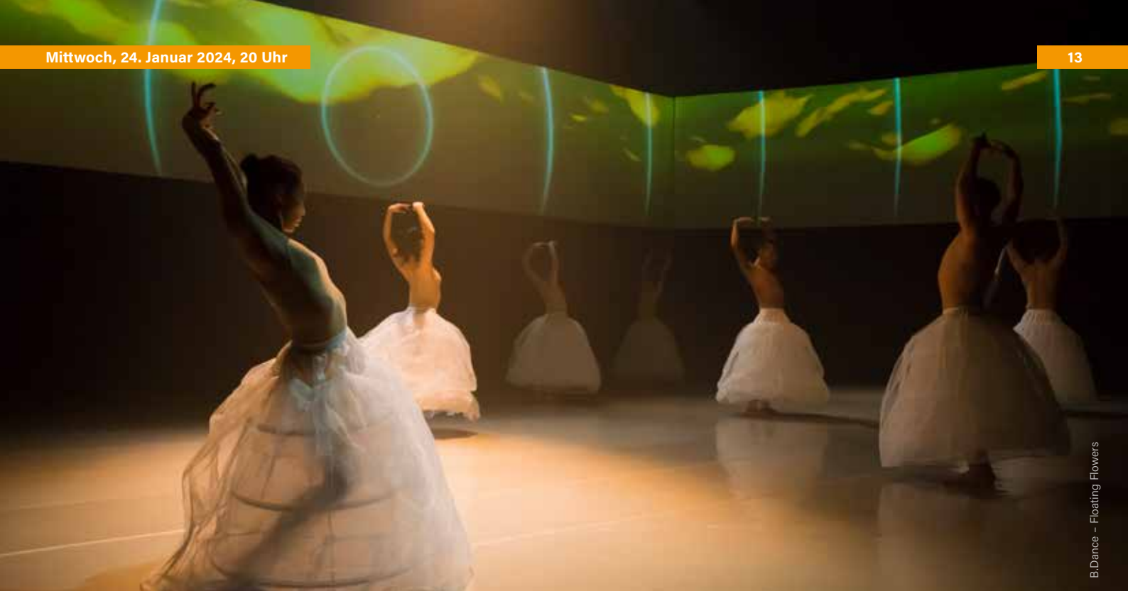
B.Dance - Floating Flowers