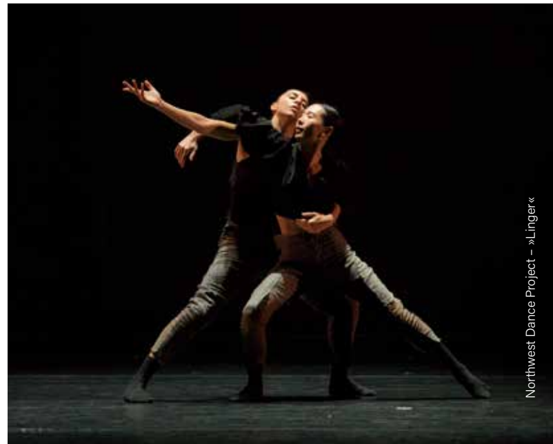
Northwest Dance Project – »Linger«

Parkplätze stehen Ihnen direkt an der Stadthalle zur Verfügung. Das Parken auf dem Außenparkplatz ist für Besucher*innen der Tanzwochen kostenfrei. Die Parkplätze in der Tiefgarage des Dorint Kongresshotel Düsseldorf/Neuss sind kostenpflichtig.